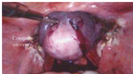
Figura 6. Extracción del cuerpo uterino.

Se efectúa finalmente el cierre de la cúpula vaginal mediante sutura laparoscópica continua de poliglactina 910 del 0 en dos planos y ésta se remata con un nudo extracorporal.