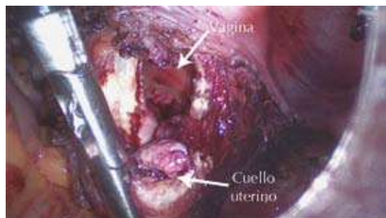
Figura 4. Seccionamiento de la porción inferior del útero.