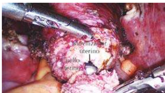
Figura 3. Cuerpo uterino colocado en la parte superior del abdomen.

Se extrae primero el cuello uterino a través de la vagina y, posteriormente, el cuerpo uterino (Figuras 5 y 6).