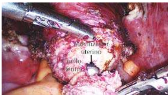
Figura 2. Sección supracervical del útero.

la parte superior del abdomen totalmente fuera del campo quirúrgico (Figura 3).