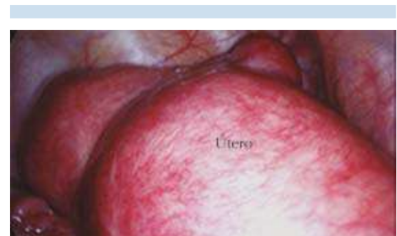
Figura 1. Pelvis prácticamente ocupada por el útero.

Esta maniobra, que es sólo temporal, permite retirar del campo quirúrgico el gran cuerpo uterino y mejorar la visibilidad, al tiempo que se facilita la movilización y el manejo de la porción inferior del útero. El cuerpo uterino se coloca en