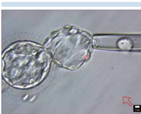
Figura 2. Biopsia de blastocisto.

embrionaria y su estudio genético es en etapa de blastocisto. La biopsia de trofotodermo no tiene un efecto negativo en el desarrollo del embrión. 27 Sin embargo, en la mayor parte de los centros que no tienen un laboratorio de genética, se requiere vitrificar los embriones. A pesar de prolongar el tiempo del tratamiento, los resultados clínicos son equivalentes al transferir embriones euploides durante un ciclo de FIV con embriones criopreservados, manteniendo los resultados clínicos. En la actualidad la etapa de blastocisto es el momento óptimo para realizar biopsias para tamizaje genético preimplantacional (Figura 2). 28,29